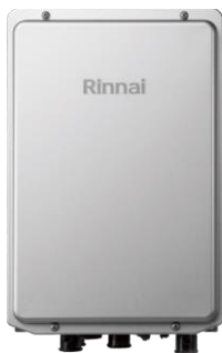
マイクロバブルバスユニット 型式UF-MBU3¥118,000

設置後10年のエネファームが去年の暮れに致命的な故障を起こし、給湯器の入れ替えを余儀なくされました、年末の慌ただししい中エコジョーズを発注し工事業者を手配して無事12月24日に工事が完了いたしました。その時に新しい物好きですのでマイクロバブルユニットも取付けちゃいました。