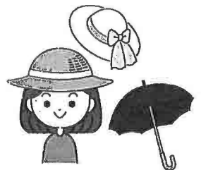
日傘をさす、帽子をかぶる