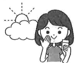
曇りでも対策を怠らない