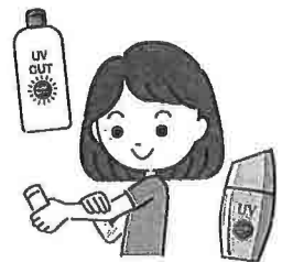
日焼け止めをこまめに塗る

見落としがちな生え際や小鼻の脇、アゴ下、耳下などのパーツも忘れずに塗りましょう。