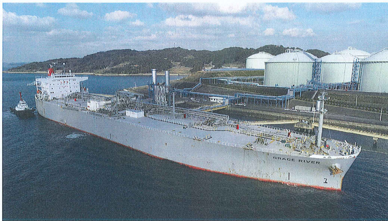
イクシスで生産されたLPガスを受け入れる九州液化瓦斯福島基地